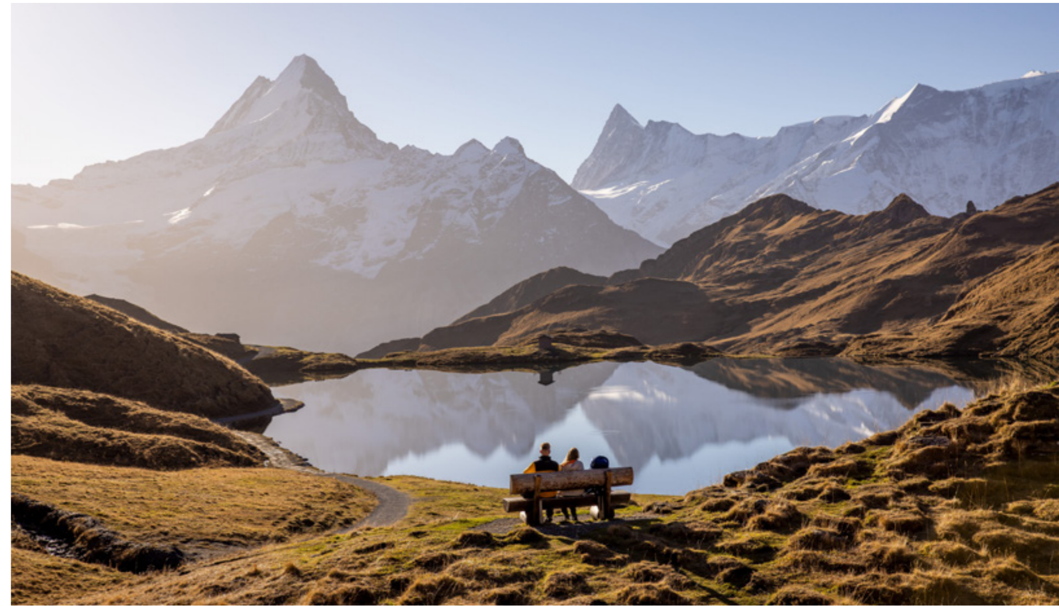
Links: Herbststimmung mit Blick zum Eiger Left: Autumn atmosphere with a view of Mount Eiger