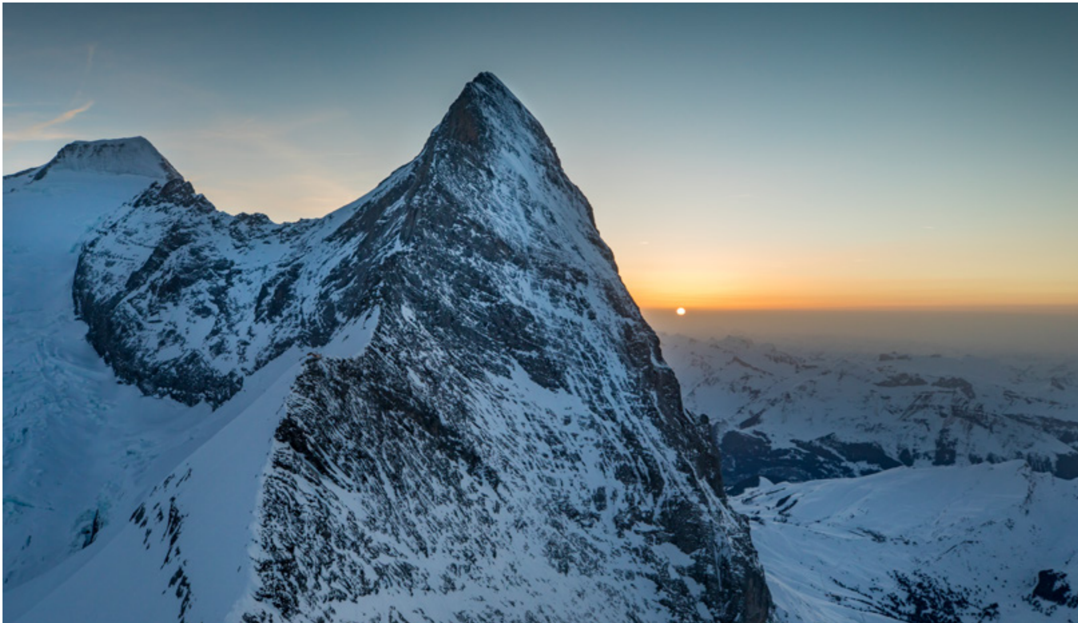
Links: Der winterliche Mittellegigrat des Eigers Left: the wintry Mittellegi ridge of the Eiger