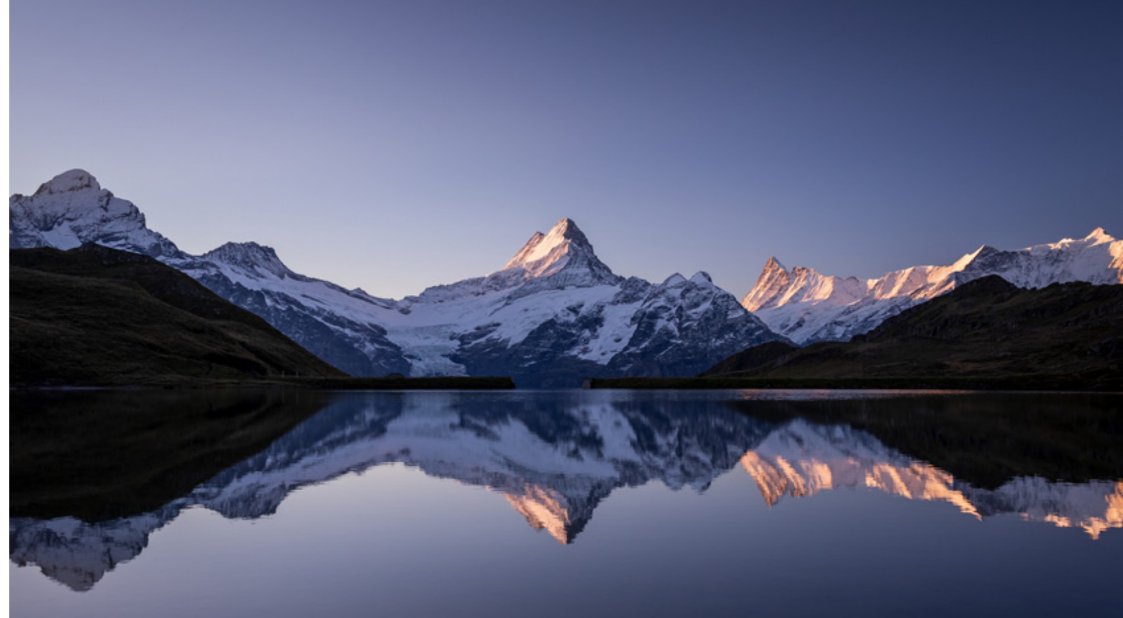
Rechts: Bachalpsee, Abendstimmung Right: Lake Bachalp evening atmosphere