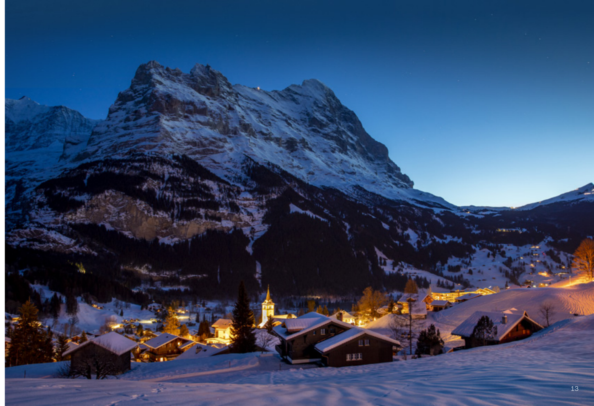
Rechts: Das verschneite Dorf Grindelwald Right: the snowy village of Grindelwald