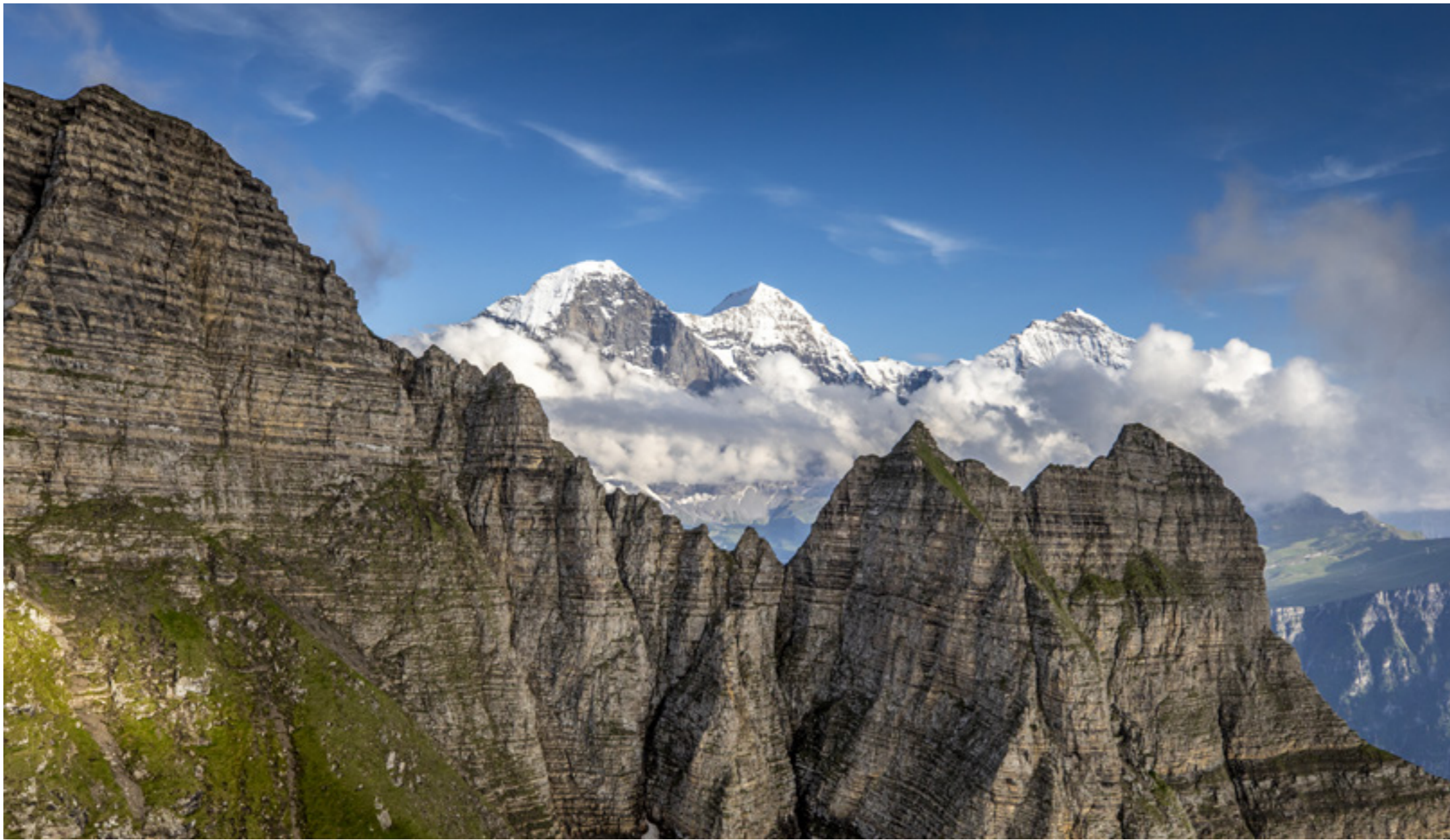
Links: Das Dreigestirn, Eiger, Mönch & Jungfrau Left: the triumvirate Eiger, Mönch & Jungfrau